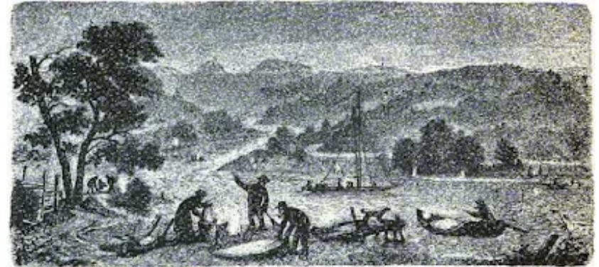
Weißwurmfang an der Oberelbe.

„Der Weißwurm zieht!“ geht's von Mund zu Mund. Die kleinen, drallen, flachköpfigen ‚Mädeln‘, die eben noch Ringelringel-Rosentanz auf der Wiese spielten, die derben, barfüßigen Buben — sie alle rennen spornstreichs durch den Ort und rufen's in die Thüren und Fenster hinein, und nun trifft jeder seine Vorkehrungen. Bald lodern auf und am Strome zahllose Feuer empor, als gälte